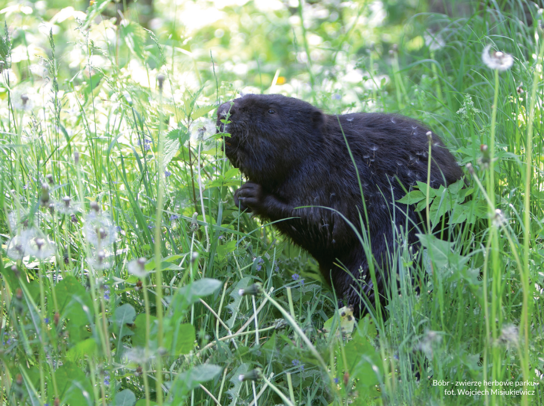
Bóbr - zwierzę herbowe parku