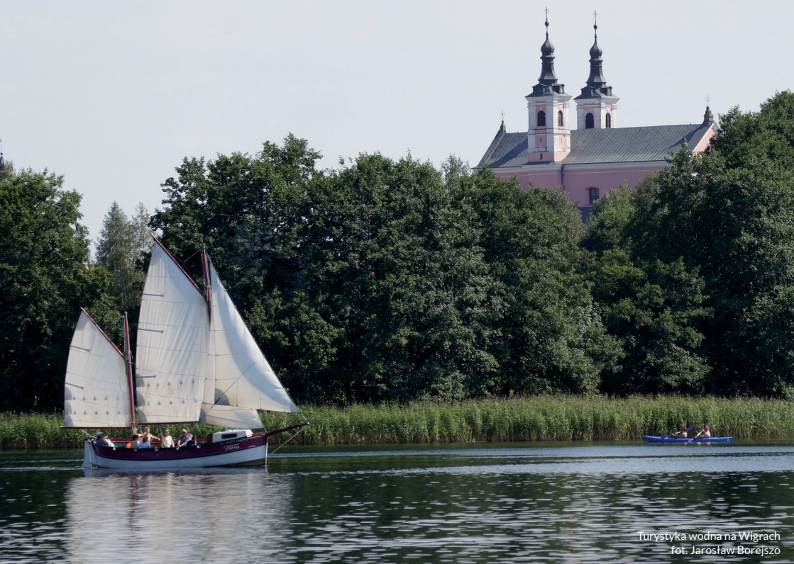
Turystyka wodna na Wigrach