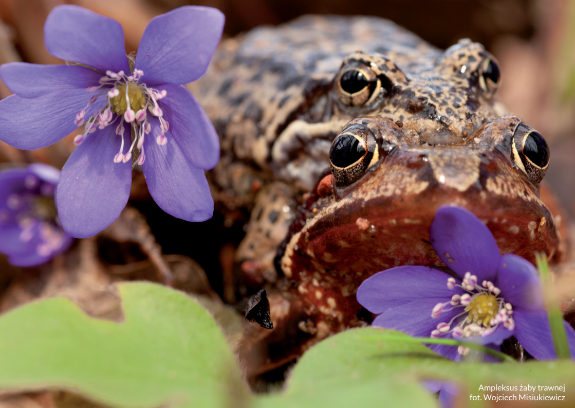
Ampleksus żaby trawnej