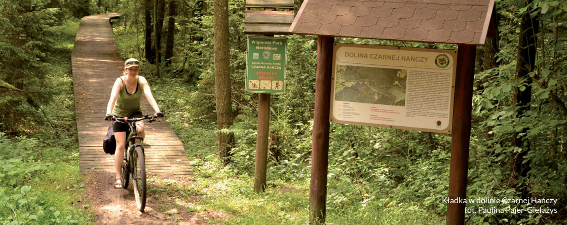
Kładka w dolinie Czarnej Hańczy